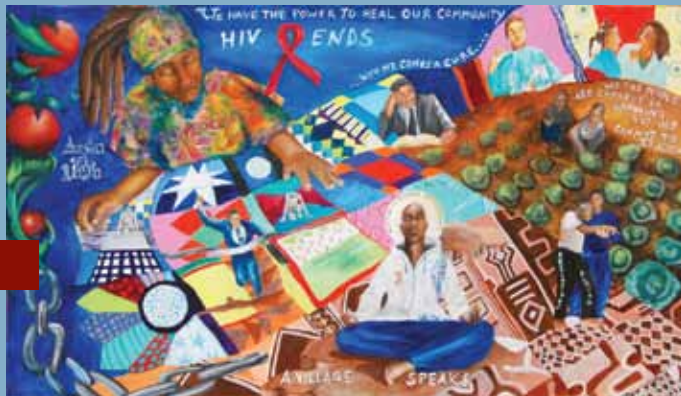
En l'honneur du HVAD à Chicago, des artistes, résidents et des politiciens se sont réunis pour une cérémonie de dédicace d'une peinture murale communautaire de 5 m sur 10 m intitulée « Austin is Doing Something » (Austin fait quelque chose, ce qui donne en anglais l'acronyme du sida : AIDS) et conçue par M. Carla Carr. Cette fresque murale sera la pièce maîtresse d'un jardin communautaire dont la réalisation est prévue.