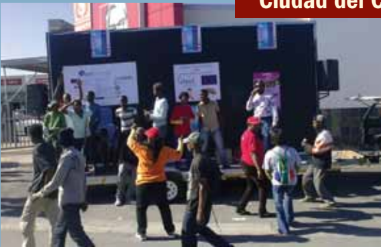
La Fundación Desmond Tutu contra el VIH en Ciudad del Cabo condujo un paseo comunitario en colaboración con su CAC para promover la prevención del VIH. También distribuyeron condones y folletos con información sobre investigaciones para prevención del VIH.