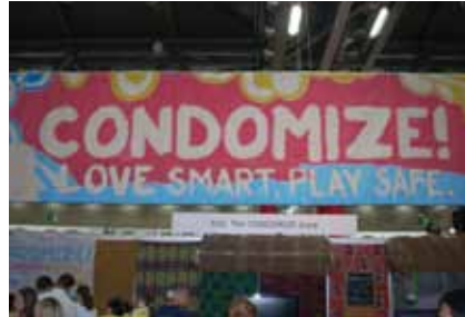
«Condomize» («condoniza»), una de las muchas campañas de prevención expuestas en la Aldea Global.