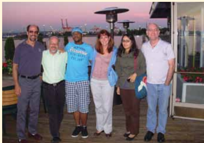
Miembros del CAC y personal de educación a la comunidad y reclutamiento en Seattle, para un taller de dos días sobre HVTN 505.

activos mientras que otros recién están formando uno. Durante la capacitación, se cubrieron temas como generalidades del 505, reclutamiento, cómo rastrear datos, VISP (siglas en inglés para seropositividad inducida por la vacuna), y se analizó la raza y el origen étnico en las investigaciones sobre vacunas. Además del personal de la Unidad de educación a la comunidad y otros miembros del personal del Centro de Operaciones Centrales que presentaron temas fundamentales, contamos con maravillosos oradores