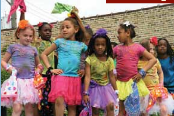
Kuumba Kids, un grupo de danza africana muestra sus movimientos en el evento del Día de concientización sobre la vacuna contra el VIH en Chicago.