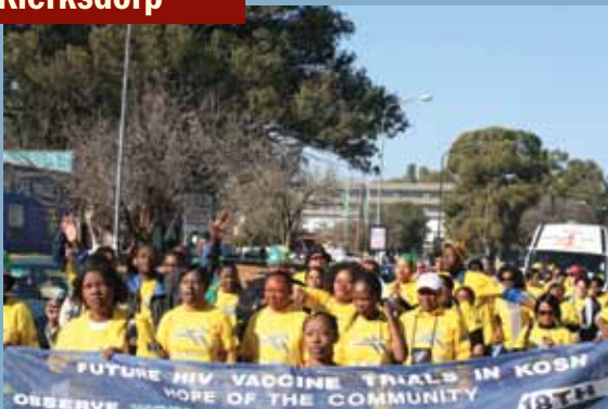
El centro KOSH en Klerksdorp conmemoró representando el espíritu de la Copa del Mundo que comenzaba 3 días después.