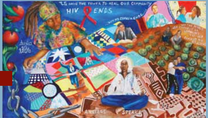
En honor del Día de concientización sobre la vacuna contra el VIH, artistas, residentes y políticos se reunieron para una ceremonia a fin de dedicar un mural comunitario de 15 x 30 pies titulado «Austin hace algo» (en inglés forma las siglas para SIDA) diseñado por M. Carla Carr. El mural será la pieza central de un futuro jardín comunitario.