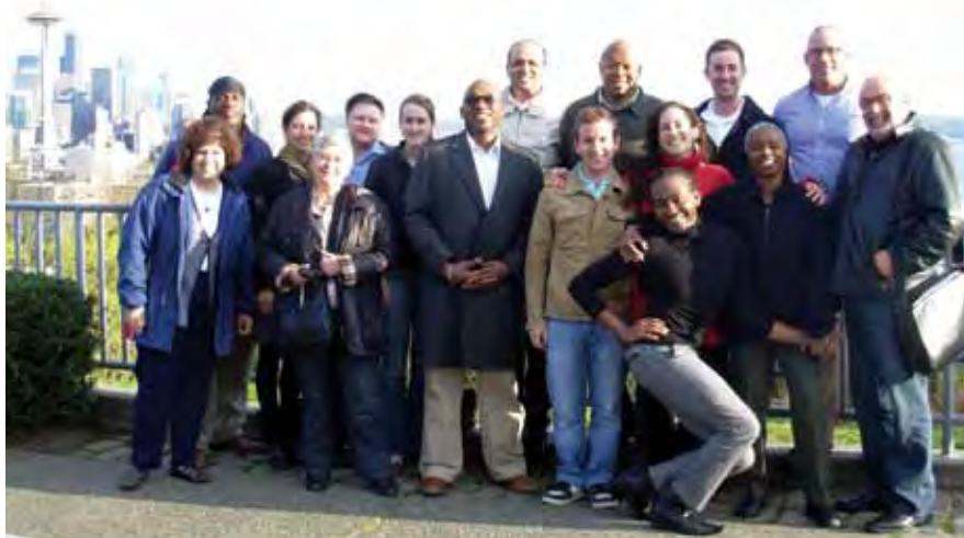
Les membres du CAB États-Unis et Suisse, à Seattle pour 3 jours de Journées de réflexion des CAB, en avril 2010.