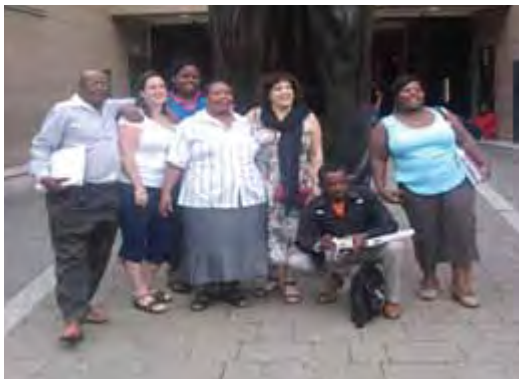
Membres des CAB d'Afrique du Sud et personnel du HVTN à Soweto, février 2010.

connaissances au cours de ces journées de réflexion. J'ai aussi prévu de travailler avec ma clinique pour faire mieux connaître la SPIV autour de nous ; nous visiterons les dispensaires locaux de conseil et de dépistage et les informerons sur la SPIV. Je tiens à adresser tous mes remerciements au HVTN et à CAPRISA pour m'avoir permis de représenter le site. J'attends avec impatience les futures relations de travail avec le personnel du HVTN et les membres du CAB.