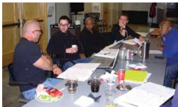
Membres du CAB discutant une étude de cas à propos de la séropositivité induite par le vaccin (SIPV).

Mais alors, voilà : on m'a assuré que je n'étais pas dans la mauvaise salle. On m'a rappelé que ma présence était souhaitée pour mon expérience, ma représentation unique de la communauté. Chacun d'entre nous, venant de villes différentes, vivant dans des contextes