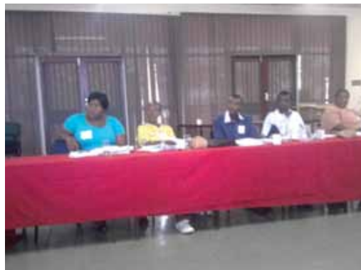
Les membres des CAB d'Afrique du Sud ont participé aux toutes premières Journées de réflexion régionales des CAB, du 5 au 7 février 2010.