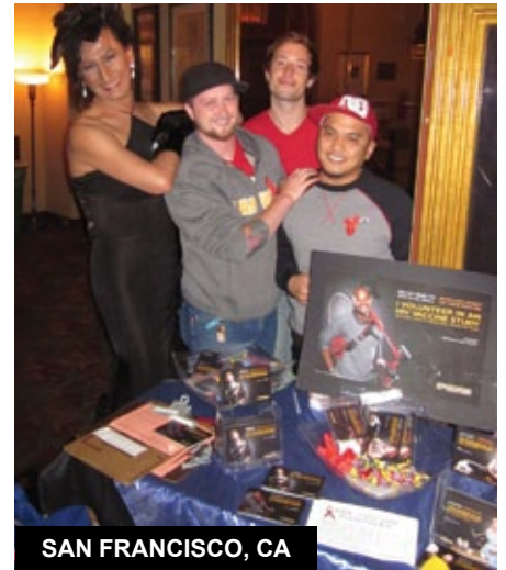
SAN FRANCISCO, CA

► Le thème de la journée de sensibilisation au vaccin contre le VIH de Medunsa (Afrique du Sud) était « Il faut un village pour combattre le VIH / SIDA ». Les membres du CAB se sont associés au site pour fournir une éducation et une sensibilisation à propos des études vaccinales contre le VIH, des possibilités de tests et d'autres problèmes de santé.