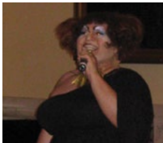
Dulce de Leche