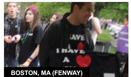
BOSTON, MA (FENWAY)