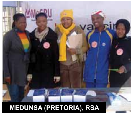
MEDUNSA (PRETORIA), RSA

► ¿Qué mejor forma de celebrar el HVAD que con los bomberos voluntarios de Lima? El personal del centro compartió información y actualizaciones sobre la prevención del VIH que incluye a los estudios de vacunas contra el VIH. Fue un día de participación activa y entusiasmo en el que los presentes reflexionaron sobre lo que costaría descubrir una vacuna efectiva para todos.