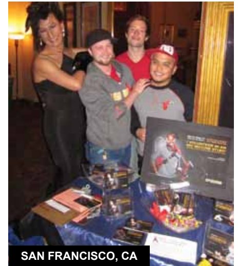
SAN FRANCISCO, CA

► El tema de Medunsa para el HVAD fue "Se necesita un pueblo para luchar contra el VIH-SIDA". Los miembros del CAC se unieron al centro para brindar educación y concientización sobre estudios de vacunas preventivas contra el VIH, opciones de pruebas y otras cuestiones de salud.