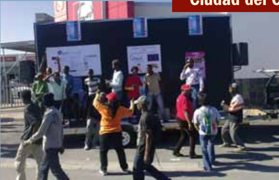
La Fundación Desmond Tutu contra el VIH en Ciudad del Cabo condujo un paseo comunitario en colaboración con su CAC para promover la prevención del VIH. También distribuyeron condones y folletos con información sobre investigaciones para prevención del VIH.