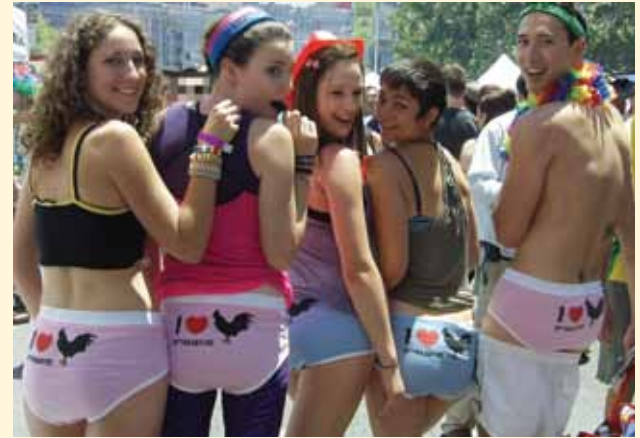
Debajo: La Sección de investigaciones sobre VIH del Departamento de Salud Pública de SF celebra el Orgullo Gay 2010 con amigos, ropa interior de regalo e información saludable.