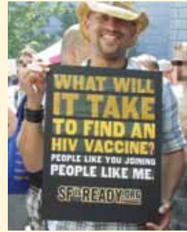
Izquierda: «¿Qué necesitamos para encontrar una vacuna contra el VIH? A gente como usted.»