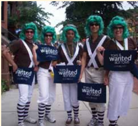
Debajo: La primera carroza de la HVTN en Boston debutó en la marcha del Orgullo 2010 con ayuda de la estrella de la serie televisión The Real World- Brooklyn de MTV, Herman Scott, que actuó de mariscal famoso de Fenway.