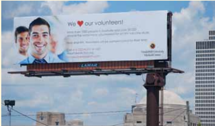
La cartelera de Vanderbilt en un lugar destacado, honrando e invitando a los voluntarios de vacunas, estaba visible para todos los que asistieran a cualquiera de las fiestas del Orgullo Gay.