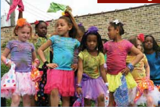
Kuumba Kids, un grupo de danza africana muestra sus movimientos en el evento del Día de concientización sobre la vacuna contra el VIH en Chicago.