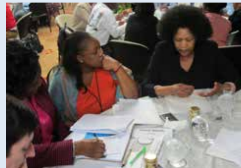
Participantes da reunião