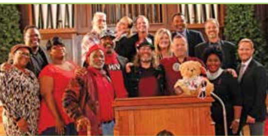
Equipa do centro no evento Dia Mundial da SIDA em 2017

Temos simplesmente que concentrar a nossa atenção no envolvimento, educação e, o mais importante, retenção destes membros carenciados da nossa família humana.