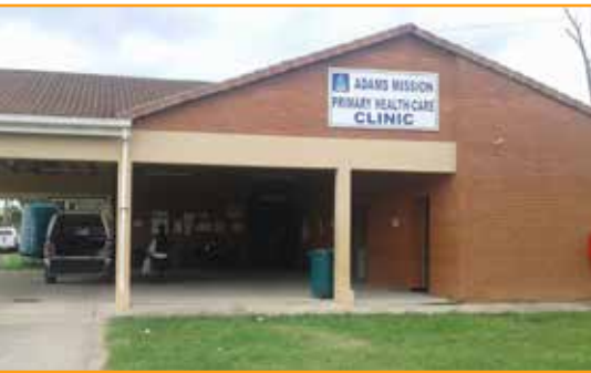
Parte da frente da Clínica Médica de Adams Mission

Quando os membros da equipa do estudo ouviram falar no conceito de AMP, não conseguiram imaginar que fosse possível. Surgiram perguntas, sobre se as pessoas saudáveis iriam aceitar a perfusão de uma substância estranha no seu corpo. Afinal de contas, a perfusão gota-a-gota destina-se a pessoas com algum problema de saúde.