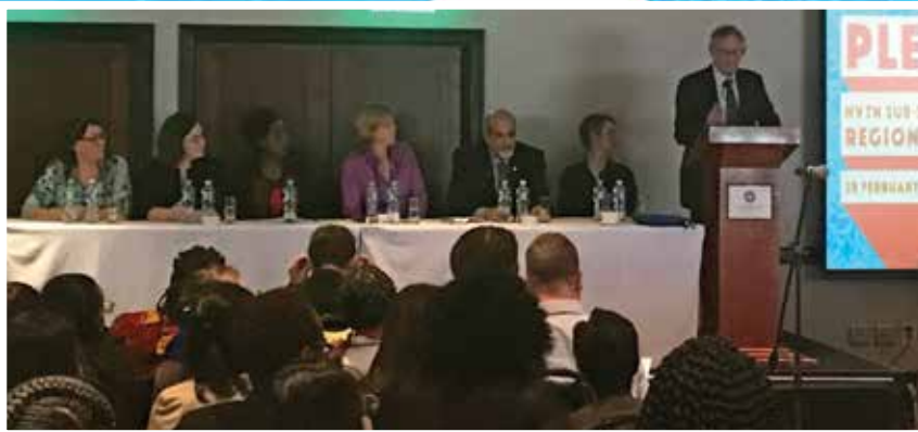
Plenário do estudo AMP: (da esquerda para a direita)