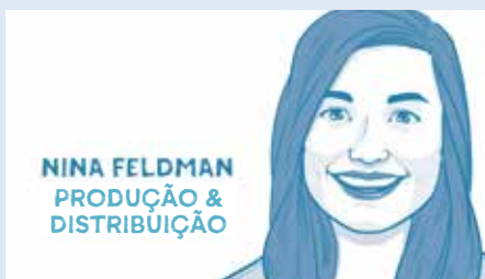
NINA FELDMAN PRODUÇÃO & DISTRIBUIÇÃO