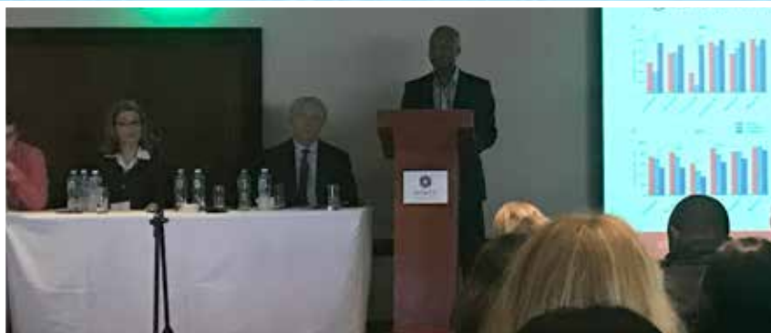
Vacinologia e Imunologia 101: Primeiro Plenário do Investigador Científico: (da esquerda para a direita)