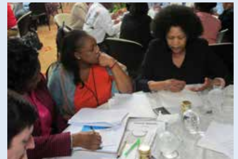
Participantes de la reunión.