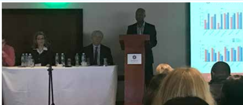
Introducción a la inmunología y vacunología: Sesión plenaria del investigador científico a primera hora (de izquierda a derecha)