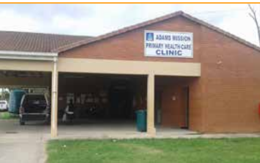
Fachada de Adams Mission Health Clinic

Cuando el personal del estudio oyó sobre el concepto de AMP, no podía imaginar que tal cosa sucedería. Surgieron preguntas sobre si las personas sanas considerarían recibir la infusión por goteo de una sustancia extraña en el cuerpo. Después de todo, se entendía que una infusión por goteo era para las personas que tenían algo mal.