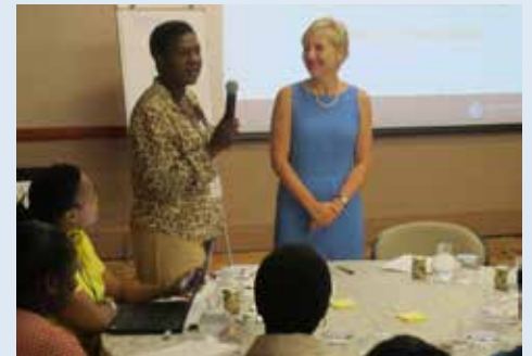
Participante de la reunión con la Dra. Glenda Grey.