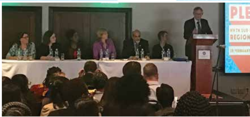
Sesión plenaria del estudio AMP: (De izquierda a derecha)