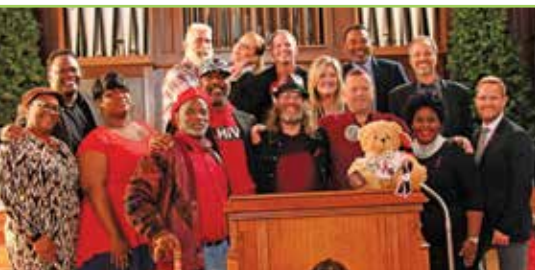
Personal de la institución en el evento del Día mundial del SIDA 2017.

Uno de cada dos hombres afroamericanos que tienen sexo con hombres en los EE. UU. contraerán el VIH en su vida si las trayectorias actuales continúan sin interrupción. En el sur, esta declaración emitida por los Centros para el Control de Enfermedad a principios de 2016 no sólo fue un desafío para los educadores e investigadores de la prevención del VIH, sino también una demanda. Simplemente debemos enfocarnos mucho en involucrar, educar y, lo más importante, retener a estos integrantes desatendidos de nuestra familia humana.