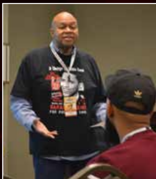
Wakefield abriendo la sesión conjunta del curso sobre la salud anal.