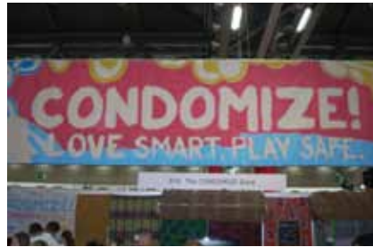
« Condomize », l'une des nombreuses campagnes de prévention affichées dans le Village mondial (ce jeu de mots intraduisible fait référence à l'utilisation banale et régulière des préservatifs).