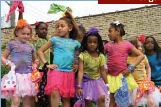
Les Kuumba Kids, un ensemble de danses africaines faisant une démonstration lors de la célébration du HVAD à Chicago.