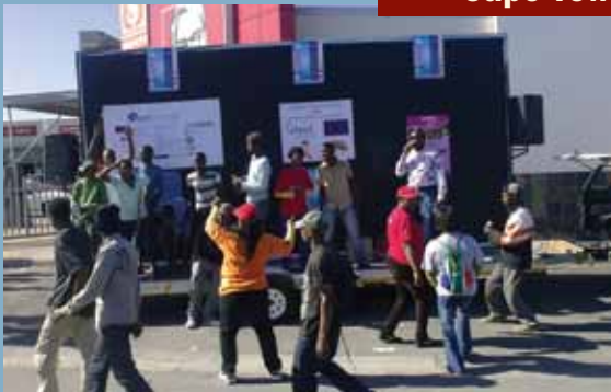
La fondation Desmond Tutu contre le VIH, dans la ville du Cap, a mené une action communautaire en collaboration avec son CAB afin de promouvoir la prévention du VIH. Ils ont également distribué des préservatifs et des brochures d'information sur la recherche pour la prévention du VIH.