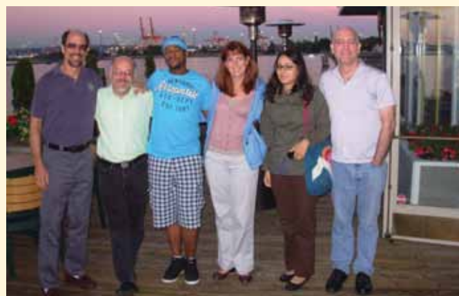
Les membres des CAB et du personnel de recrutement et d'éducation communautaire pendant un atelier de deux jours, à Seattle, sur l'étude HVTN 505.

moment déjà. Cela est également vrai pour l'implication d'un CAB : certains sites ont des CAB actifs alors que d'autres sont seulement en train de les constituer. Au cours de la formation, nous avons couvert des thèmes, tels qu'une vue d'ensemble de l'étude 505, de son recrutement, de la façon de suivre les données, de la SPIV (séroposivité induite par le vaccin) et discuté des questions de race et d'ethnie dans le cadre de la recherche vaccinale. En plus du personnel de l'Unité d'éducation communautaire et des autres