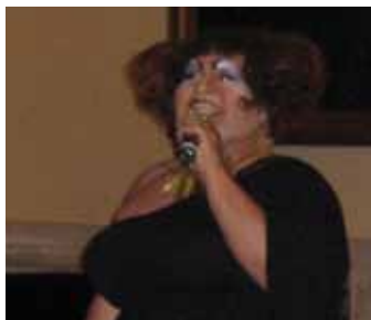
Dulce de Leche