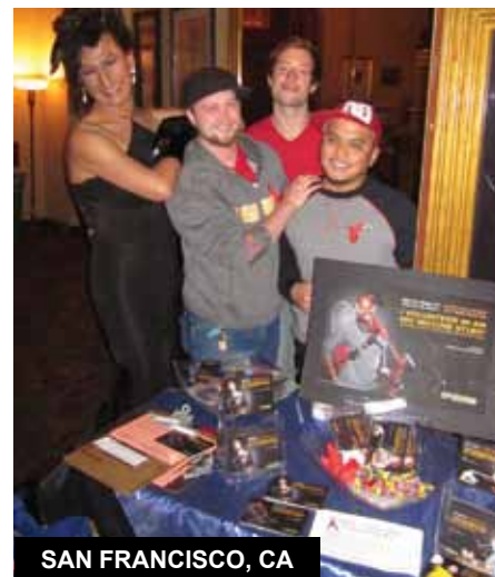
SAN FRANCISCO, CA

► El tema de Medunsa para el HVAD fue "Se necesita un pueblo para luchar contra el VIH-SIDA". Los miembros del CAC se unieron al centro para brindar educación y concientización sobre estudios de vacunas preventivas contra el VIH, opciones de pruebas y otras cuestiones de salud.