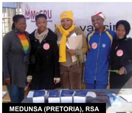
MEDUNSA (PRETORIA), RSA

► ¿Qué mejor forma de celebrar el HVAD que con los bomberos voluntarios de Lima? El personal del centro compartió información y actualizaciones sobre la prevención del VIH que incluye a los estudios de vacunas contra el VIH. Fue un día de participación activa y entusiasmo en el que los presentes reflexionaron sobre lo que costaría descubrir una vacuna efectiva para todos.