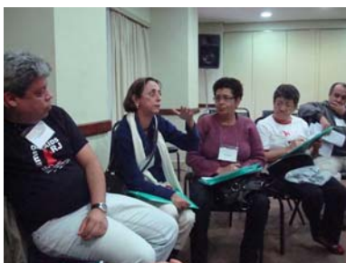
Miembros de la comunidad de Iquitos (arriba) y San Pablo (debajo) debatiendo las GPP.

Por último, una vez que las pautas estuvieran circulando ampliamente, el grupo recomendó el desarrollo de estudios de investigación de ciencias sociales para evaluar las experiencias con la utilización de las pautas en el campo. Consideraron que la diseminación de esta información ayudaría a fortalecer las conexiones entre las instituciones investigadoras y los miembros de la comunidad a fin de llegar a las poblaciones más diversas, que juegan un papel fundamental en los ensayos clínicos.