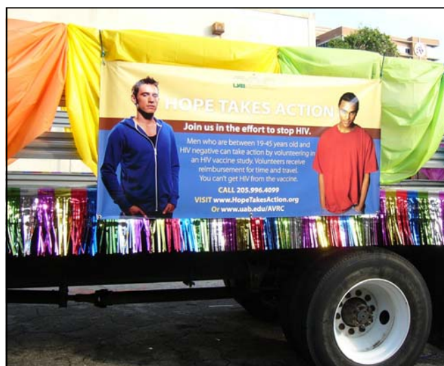
Birmingham muestra su pancarta de "Hope Takes Action," parte de la campaña de HVTN 505, durante el desfile del Orgullo Gay el 13 de junio de 2009. Más fotos de Orgullo Gay están en la página 5.

La próxima Conferencia de la HVTN es del 17 al 19 de noviembre de 2009 en Seattle, WA